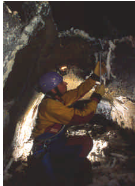
Fig. 3 - Grotta del Fumo: Pozzo d'ingresso.